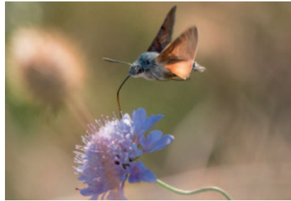
Moro-sphinx en vol stationnaire