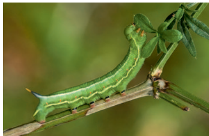
Chenille du Moro-sphinx

Moro-sphinx: 1. Ailes postérieures orange 2. Trompe repliée