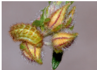
Chenille de l'Argus vert

Répandu dans toute l'Europe, l'Argus vert s'est adapté à de nombreux milieux, du bord de mer jusqu'à la moyenne montagne. Sa couleur verte lui permet de se camoufler facilement parmi les feuillages. Lorsque le papillon éclot, le dessous de ses ailes est marron. Ce n'est qu'une fois sèches que les ailes de l'Argus vert prennent cette couleur si caractéristique !