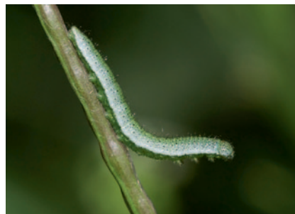
Chenille de l'Aurore