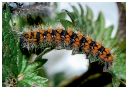
Chenille de l'Écaille chinée