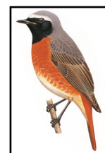
Rougequeue à front blanc