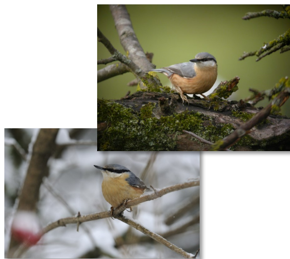
Mâle et femelle

Mâles, femelles et juvéniles ont un plumage identique. La Sittelle se reconnaît facilement car c'est le seul oiseau capable de descendre un arbre en ayant la tête en bas.