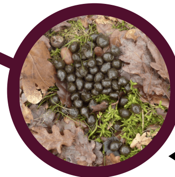
◀ "Moquettes" (excréments)