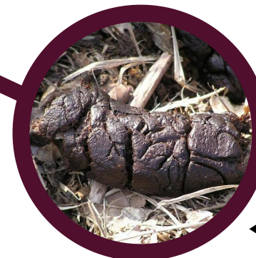
▲ "Laissées" (excréments)