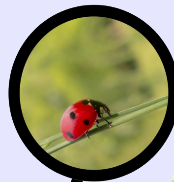
Coccinelle à sept points